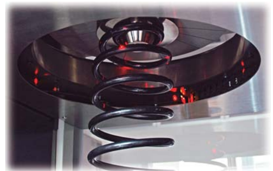
4台のレーザーによる外径測定イメージ

圧縮力 / 横力 / 作用角度のグラフ、重心位置、3Dデータが同時に ※ 画面は開発中のものです。